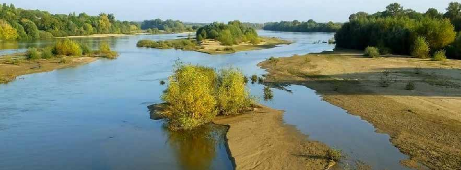
La Loire dans la Nièvre